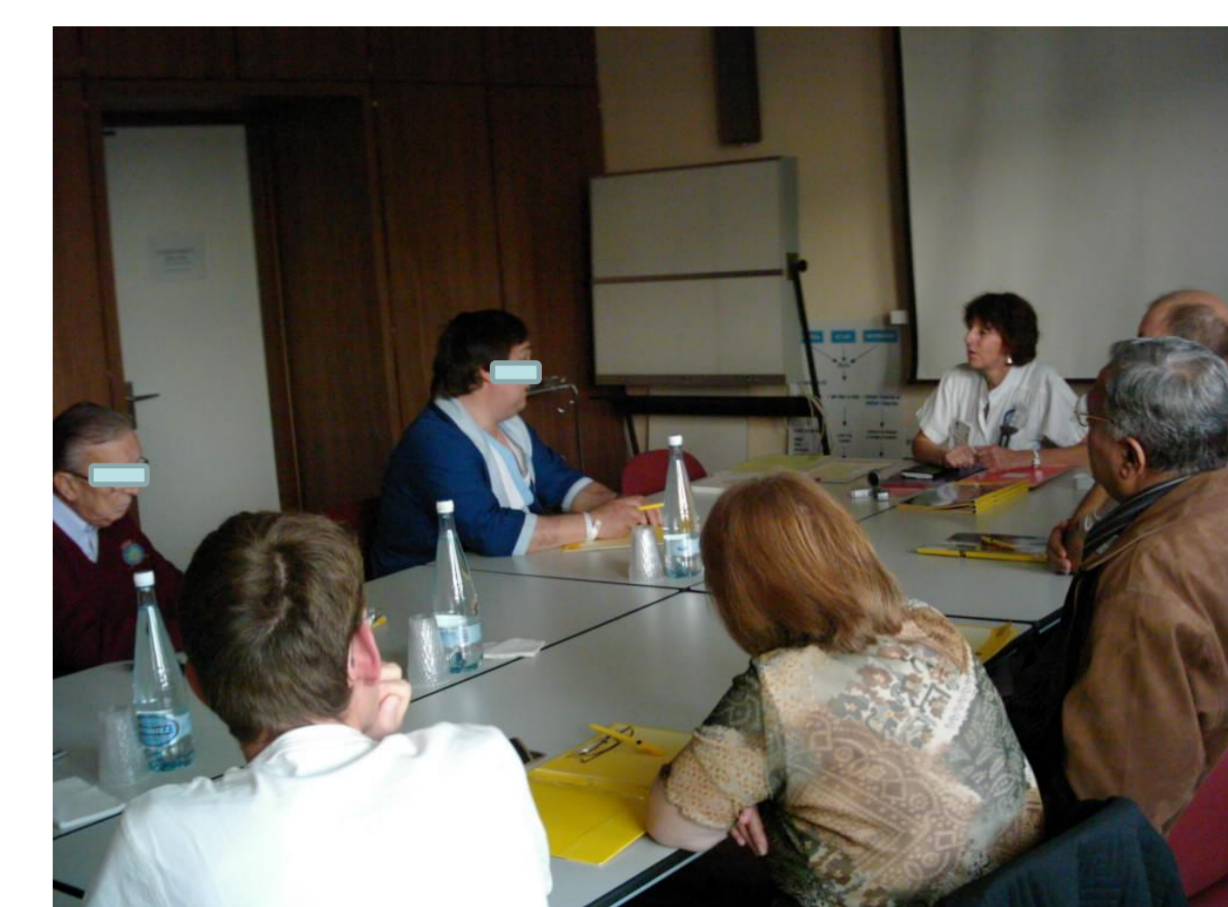
Organisation et animation par l'infirmière spécialiste clinique: